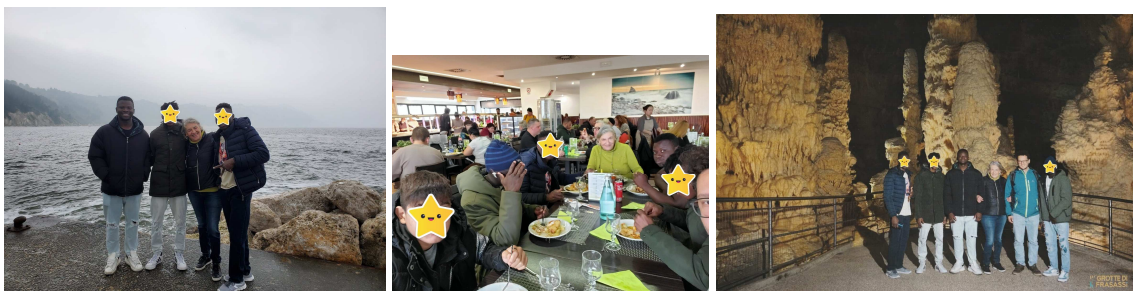
Momenti delle uscite dei ragazz* di Casa Valturio e "Se potessi" a novembre 2024 alle grotte di Frasassi - Ancona