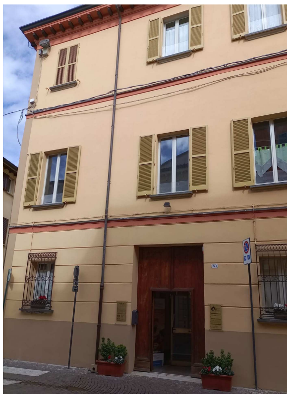
Palazzo Soleri _ Rimini sede della Fondazione San Giuseppe

La Fondazione promuove anche un approccio professionale e moderno nella gestione dei servizi sociali, cercando di ottimizzare le risorse economiche e migliorare la qualità dei servizi offerti. Si propone di coordinare e valorizzare le risorse disponibili a livello locale nel settore educativo, sociale e socio-sanitario, collaborando con i Comuni e altri Enti responsabili dei servizi sociali e sanitari sia locali che a livello nazionale.