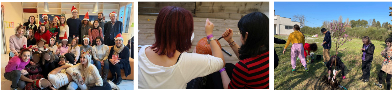
Attività interne ed esterne a Casa San Lorenzo