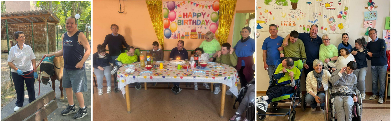
Momenti di attività con la pet-therapy e altri momenti ludici della Comunità "La Sorgente"

evacuazione/antincendio, gestione pasti/pulizie/manutenzione, rilevazione attività e dati sull'utente, inserimenti/dimissioni.