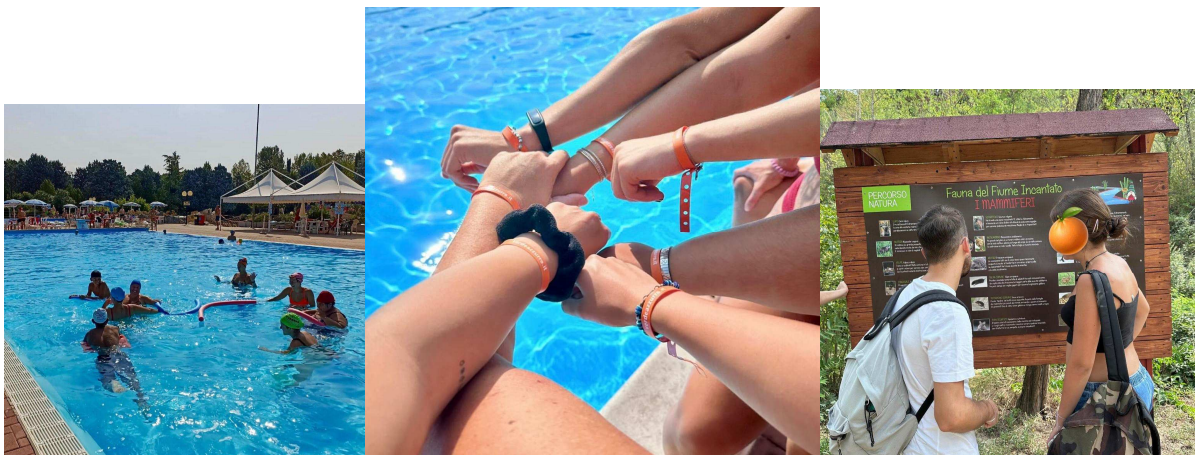
Momenti delle vacanze della Comunità Clementini a settembre 2024 presso l'Acquaparco Verde Azzurro in provincia di Macerata