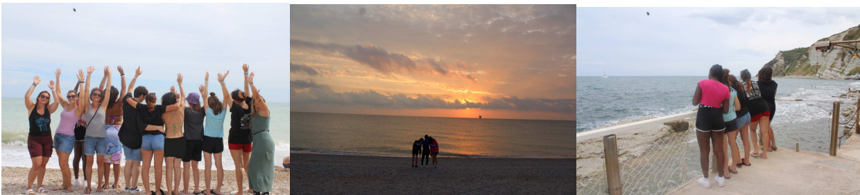
Momenti delle vacanze di Casa San Lorenzo a settembre 2024 alla Risacca Family Camping Village di Porto Sant'Elpidio.

DIMISSIONE A partire dal progetto educativo integrato condiviso e costantemente aggiornato, anche la dimissione è una fase progettuale altrettanto delicata e significativa. Per questo motivo, salvo cause di forza maggiore (situazioni in cui il comportamento individuale metta a rischio la propria incolumità, quella altrui o la tenuta stessa del servizio complessivamente inteso) la dimissione dovrà essere adeguatamente predisposta e assolutamente rispettosa dei tempi e delle modalità stabilite con il soggetto inviante, con il minore stesso e con la sua famiglia. In stretta sinergia con i servizi coinvolti, sarà effettuata un'attenta valutazione delle opzioni percorribili al fine di mantenere, in un tempo congruo di post dimissione, un monitoraggio del minore e del suo nucleo familiare.