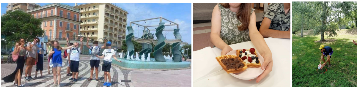
Momenti del centro estivo "Estate a Palazzo" che si è svolto presso Casa Calicanto.

L'accesso avviene attraverso formale richiesta del servizio pubblico mediante una relazione contenente: dati anagrafici del minore e dei familiari, indicatori del disagio del minore e della famiglia, eventuali provvedimenti della autorità giudiziaria, finalità dell'inserimento ed obiettivi.